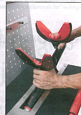
Fjederspænderen gør afmonteringen nemmere.

- Vi har oplevet en stigende interesse for vores nyudviklede arbejdsstation. Sikkerhed, fleksibilitet og brugervenlighed kendetegner produktet, hvilket i høj